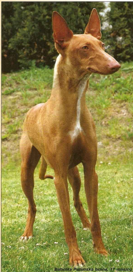
Babečka Putimská brána, 17 měsíců

Poznámka: psi musejí mít dvě normální, stejné velké varlata plně sestoupá v šourku.